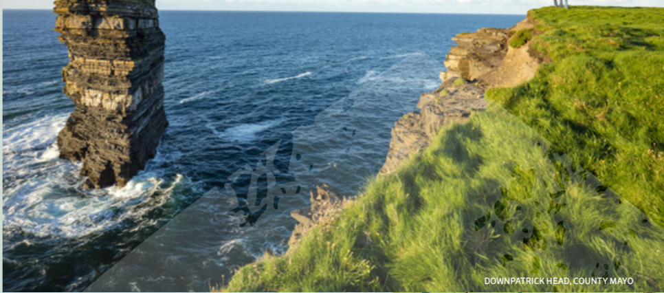
DOWNPATRICK HEAD, COUNTY MAYO

Una playa rural protegida rodeada de acantilados en Achill, la isla más grande de Irlanda. Situado en la cabecera de un valle entre los acantilados de Benmore y la montaña de Croaghau, para llegar a este lugar idílico sólo hay que seguir la ruta Atlantic Drive hasta Keel y continuar hacia el oeste a través de una carretera en la cima de un acantilado con espectaculares vistas al Océano Atlántico.