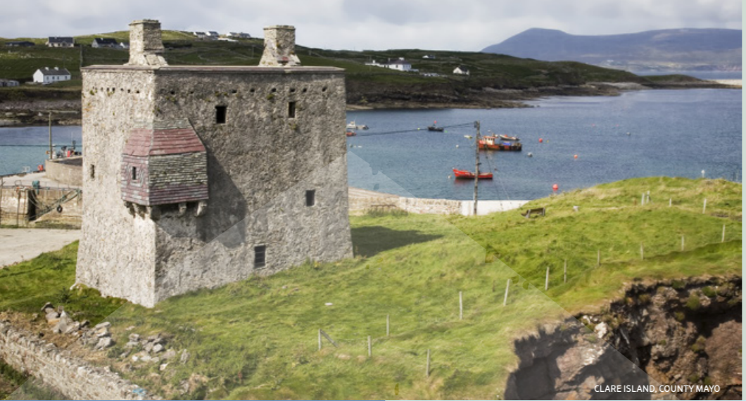
CLARE ISLAND, COUNTY MAYO

Para obtener una lista completa de todas las actividades que se pueden ver y hacer en la zona incluyendo pesca con caña, ciclismo, equitación, jardines, golf, senderismo y mucho más, visite www.WildAtlanticWay.com