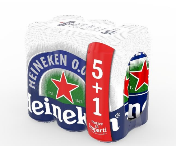
6 pack Heineken 0.0 doza 0.5l 5+1