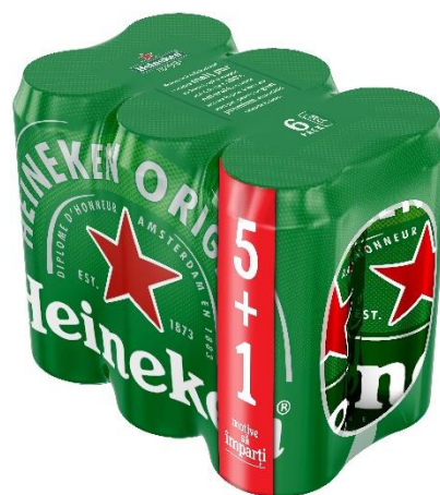
6 pack Heineken doza 0.5l 5+1