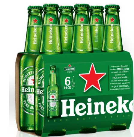
6 pack Heineken sticla 0.33l