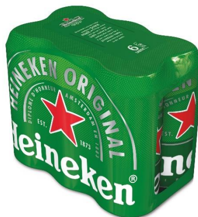
6 pack Heineken doza 0.5l