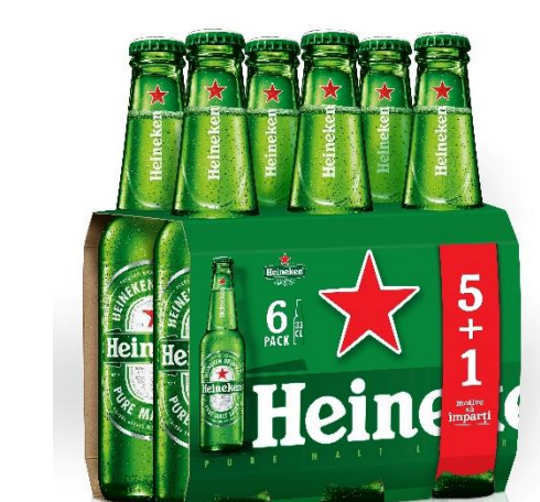
6 pack Heineken sticla 0.33l 5+1