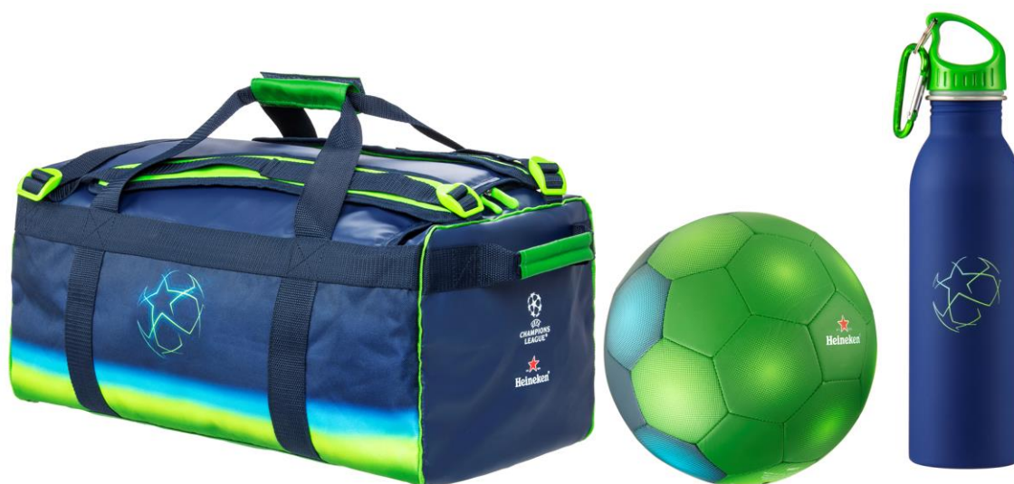
Kit suporter: geanta sport + mingea fotbal + sticla de apa

*Imaginile premiilor sunt cu titlu informativ