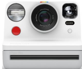
Camera foto Polaroid