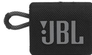
Boxa portabila JBL

*Imaginile premiilor sunt cu titlu informativ