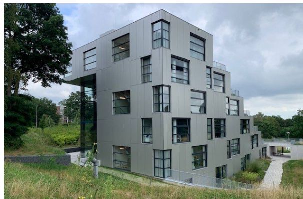
Aanzicht van Het Oosterveld 1 bij aankomst