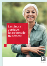
Options de traitement