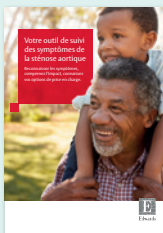
Outil de suivi des symptômes