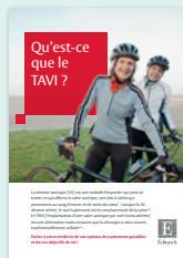
Qu'est-ce que le TAVI ?