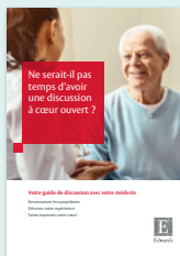
Guide de discussion avec le médecin