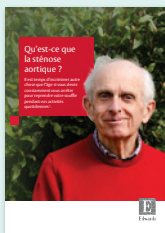
Sensibilisation à la maladie

Découvrez d'autres ressources sur la SA :