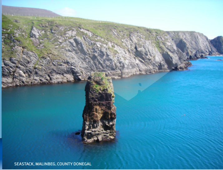
SEASTACK, MALINBEG, COUNTY DONEGAL

La spectaculaire côte du comté n'a rien à envier à son intérieur sauvage. Elle est composée d'une très populaire série de falaises à pic, de grands arcs de sable doré et de péninsules recouvertes d'ajoncs qui se jettent dans les eaux bouillonnantes de l'Atlantique Nord. Vous pouvez surfer à Rosnowlough , aller faire de l'équitation sur Trá na Rossan à Rosguill et vous promener sur la plage dans un isolement splendide à Tramore , juste à la sortie de Dunfanaghy. Les falaises marines de Slieve League sont les plus hautes d'Irlande, chutant de 600 m jusqu'aux vagues déchainées en contrebas, leurs coteaux surélevés abritent les vestiges d'un site chrétien du haut Moyen Âge, avec toutes ses Clochán et sa chapelle. Il devait leur sembler qu'ils vivaient au bout du monde. Si vous explorez — ne fût-ce qu'un instant — ce comté sauvage et magnifique, vous comprendrez exactement ce qu'ils devaient ressentir.