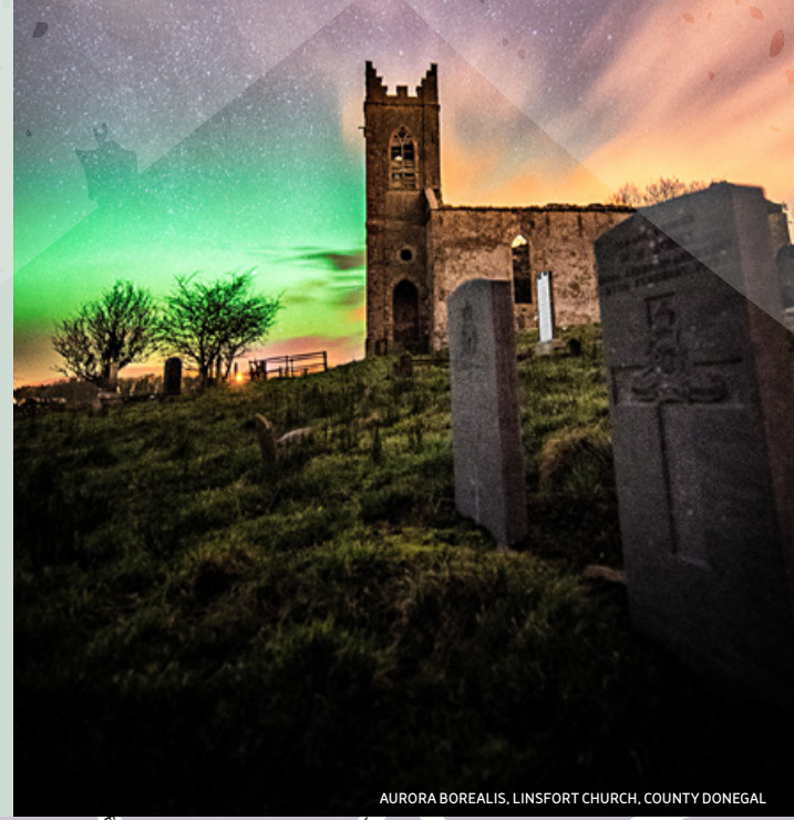
AURORA BOREALIS, LINSFORT CHURCH, COUNTY DONEGAL

Plus d'informations disponibles sur www.WildAtlanticWay.com