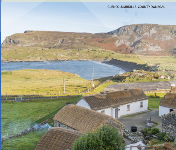
GLENCOLUMBILLE, COUNTY DONEGAL

Grassroutes www.grassroutes.ie Explorez Donegal sur un vélo électrique ou hybride. Termon, County Donegal.