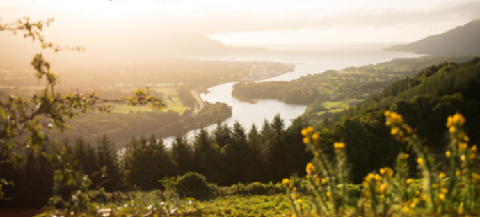
FLAGSTAFF VIEWPOINT, COUNTY LOUTH

FI-10724-MCLMW-ITA-0419 Mappa © Fáilte Ireland 2018. Fáilte Ireland declina ogni responsabilità per eventuali errori od omissioni contenute in questa mappa. Design della mappa www.speardesign.ie. Dati cartografici originali nel marzo 2018 © OpenStreetMap.org. Per feedback, si prega di contattare - visitors@failteireland.ie