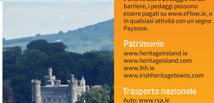
TULLYALLY CASTLE GARDENS, COUNTY WESTMEATH

rilassato e amichevole. Ci sono diversi punti di accesso a vari strade pubbliche. OLD RAIL TRAIL The Old Rail Trail è un percorso rurale attraverso il cuore delle Midlands Irlandesi che collega la vivace città di Athlone con la città mercato di Mullingar passando per la città di Moate. Il percorso si snoda per 42 km lungo un tratto convertito dell'ex Midlands Great Western Railway e passa attraverso fertili terreni agricoli lontani dal caos e dalla frenesia delle città.