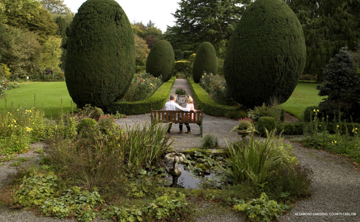
ALMONT GARDENS, COUNTY CARLOW