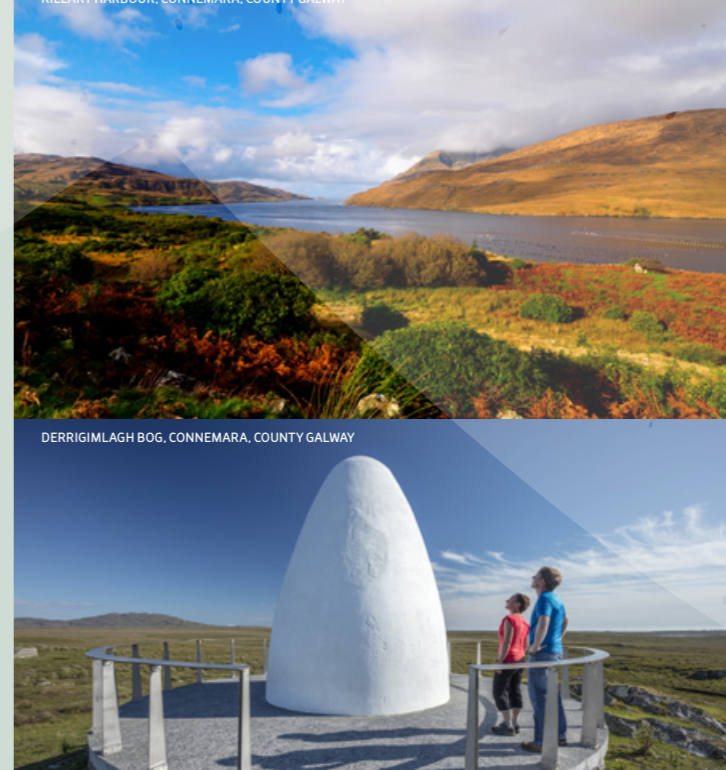
KILLARY HARBOUR, CONNEMARA, COUNTY GALWAY

Atractivos turísticos emblemáticos Killary Harbour Situado en el corazón de Connemara, Killary Harbour ("An Caoláire Rua" en irlandés) es un fiordo que forma una frontera natural entre los condados de Galway y Mayo. Aquí encontrará algunos de los paisajes más espectaculares de Irlanda. Desde la orilla norte del puerto se eleva Mweelrea, la montaña más alta de Connemara, con 814 metros de altitud. Al sur se pueden contemplar las Maumturk Mountains y los Twelve Bens. Derrigimlagh Situado 4 km al sur de Clifden, este impresionante pantano está formado por un mosaico de diminutos lagos y turba espectacular, donde podrá detenerse y contemplar dos enclaves de importancia histórica internacional. En primer lugar, pasará por los restos dispersos de la primera estación de radio transatlántica permanente del mundo, construida hace más de un siglo por el inventor italiano Guglielmo Marconi y que transmitió la primera señal de radio transatlántica en 1907. En las cercanías también encontrará un monumento de color blanco en forma de ala de avión que rinde homenaje a John Alcock y Arthur Whitten Brown que, en 1919, fueron los primeros pilotos en volar sin escalas a través del Atlántico, antes de estrellarse (de manera segura) en Derrigimlagh Bog.