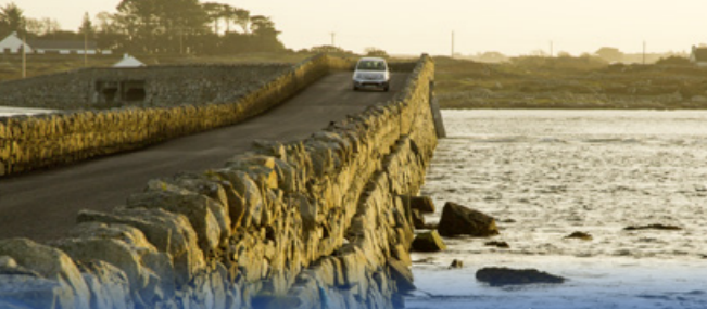
CARRICKLEGAN BRIDGE, CEANTAR NA NOLÉAN, COUNTY GALWAY

FI-110724-G-SPA-0419. Mapa © Fáilte Ireland 2018. Fáilte Ireland no se hace responsable de los errores u omisiones contenidos en este mapa. Diseño del mapa www.spear.design.ie. Los datos del mapa original se obtuvieron en marzo de 2018 © OpenStreetMap.org. En caso de comentarios o sugerencias, póngase en contacto con visitmap@failteireland.ie