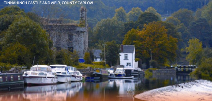
TINNAHINCH CASTLE AND WEIR, COUNTY CARLOW

FI-10724-TWCK-GER-0419 Karte © Fälte Ireland 2018. Fälte Ireland übernimmt keine Verantwortung für jegliche Fehler oder Auslassungen in dieser Karte. Kartendesign: www.spcardesign.ie Kartographische Originaldaten bezogen März 2018 © OpenStreetMap.org. Anregungen bitte an - visitmaps@falteireland.ie