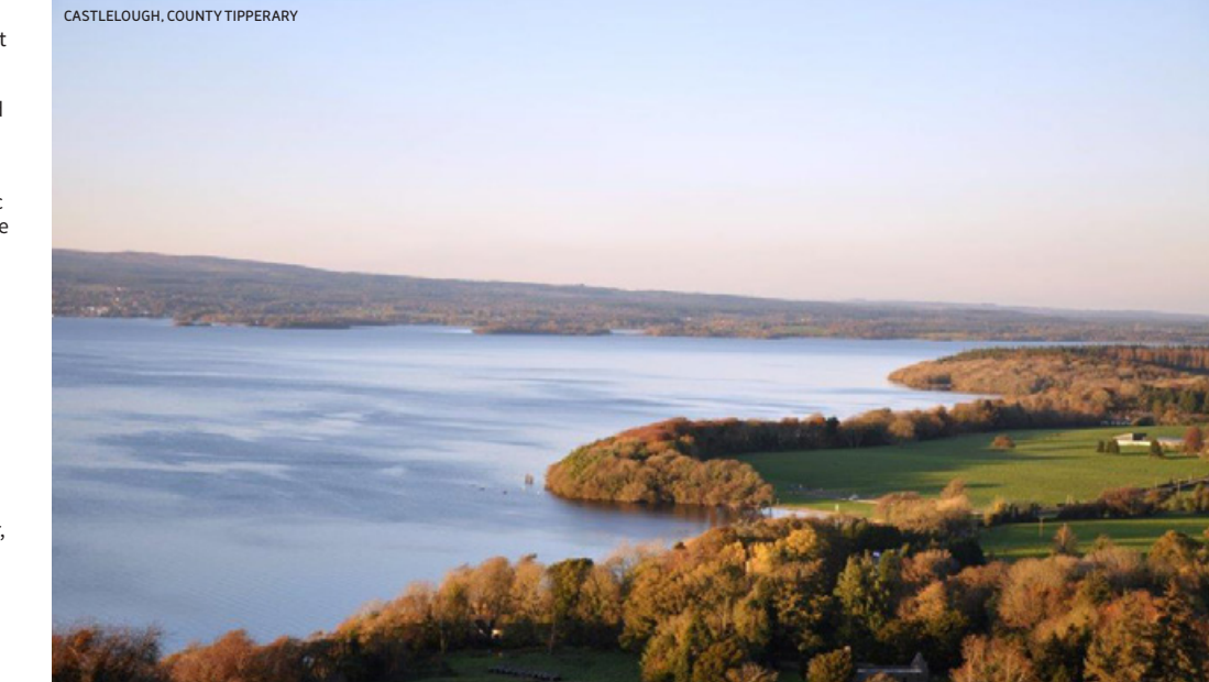
CASTLELOUGH, COUNTY TIPPERARY

Bitte wenden Sie sich an die örtlichen Touristenbüros für Informationen über private Busbetriebe im ganzen Land.