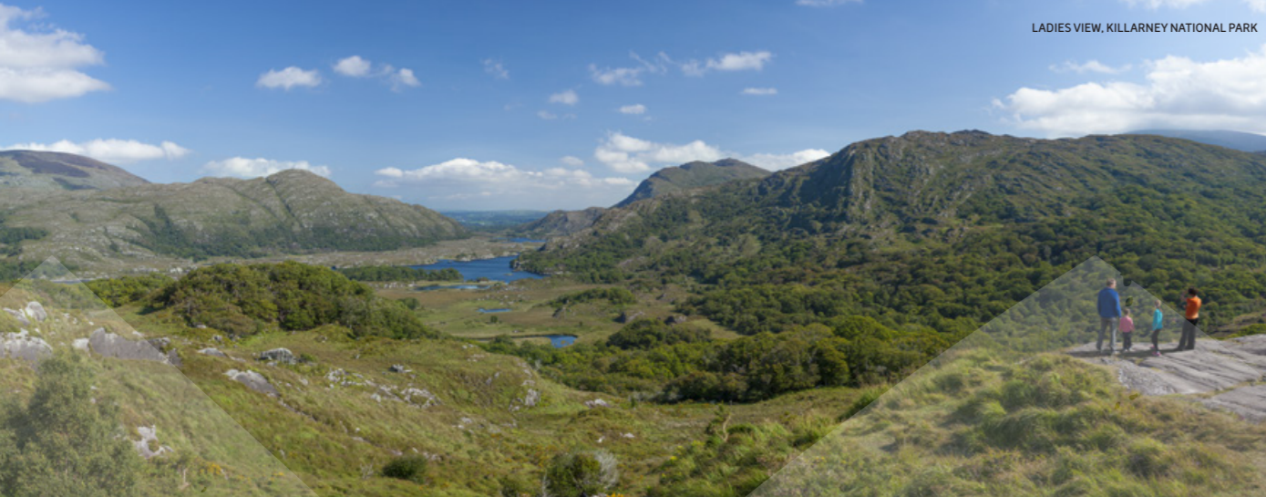
ACTIVITÉS ET AVENTURES : SUITE