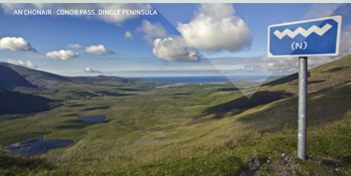
AN CHONAIR - CONORPASS, DINGLE PENINSULA

Situé à Listowel le Garden of Europe (Jardin d'Europe) contient plus de 3 000 arbres et arbustes, et est divisé en 12 sections représentant les 12 États membres de l'Union européenne lors du début du projet.