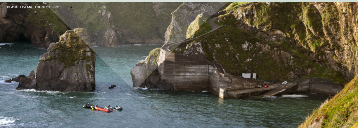
BLASKET ISLAND, COUNTY KERRY