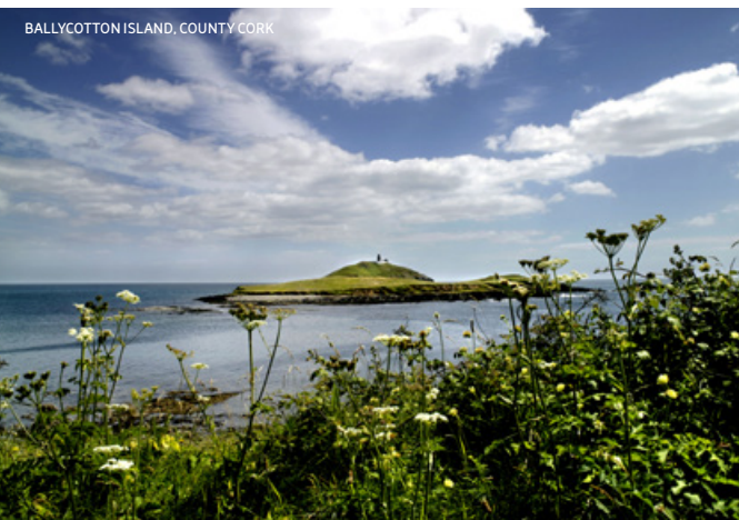
BALLYCOTTON ISLAND LIGHTHOUSE, COUNTY CORK