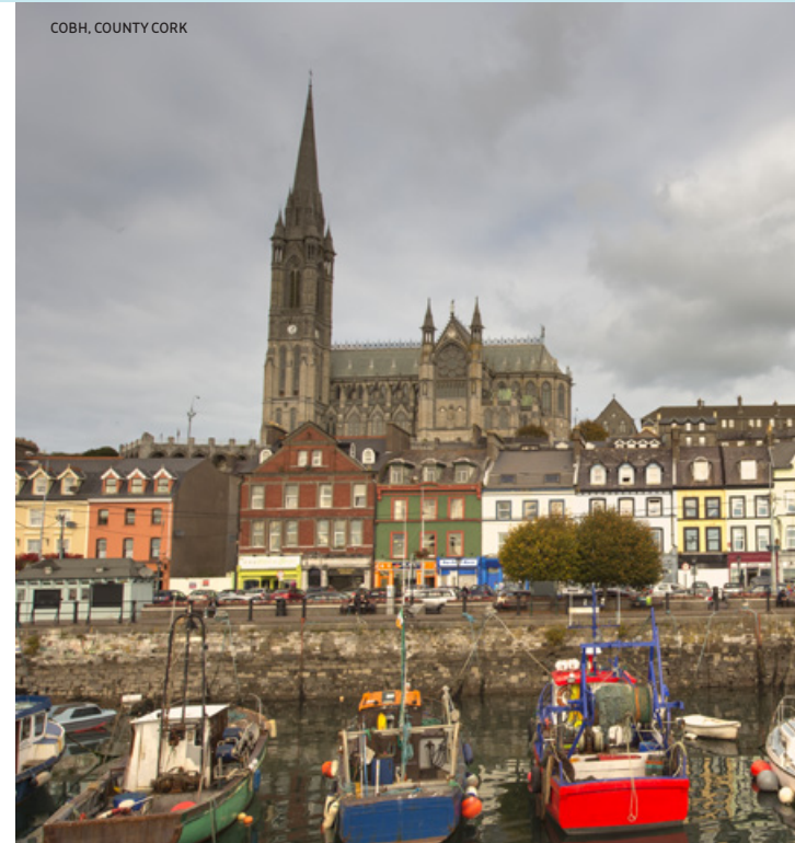
COBH, COUNTY CORK