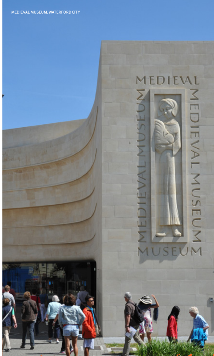
MEDIEVAL MUSEUM, WATERFORD CITY

Pour la liste complète de tout ce qu'il y a à faire et à voir dans la région y compris la pêche à la ligne, les randonnées à vélo, à cheval, les terrains de golf, les randonnées, et bien plus encore — veuillez consulter www.irelandsancienteast.com