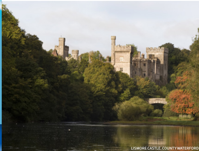
LISMORE CASTLE, COUNTY WATERFORD

Sans oublier la gastronomie. L'art de la table de cette région a une réputation quasi inégalée. La dynamique Dungarvan a quelques excellents restaurants et une prestigieuse école de cuisine. À la mi-avril, elle accueille également l'un des meilleurs festivals gastronomiques du pays : le West Waterford Festival of Food. Cependant, le cœur non officiel de la haute-cuisine en Irlande se trouve de l'autre côté de la frontière du comté dans la région d' East Cork : l'établissement de Ballymaloe dans le village de Shanagarry. Ce bâtiment est le quartier général de la famille Allen, qui dirige une des meilleures écoles de cuisine en Europe.