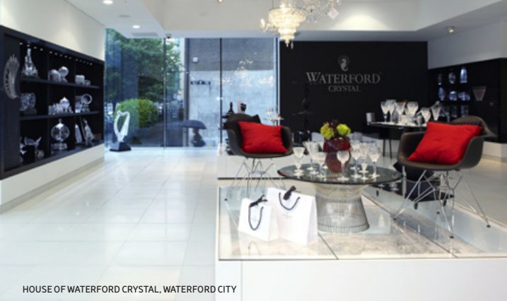
HOUSE OF WATERFORD CRYSTAL, WATERFORD CITY