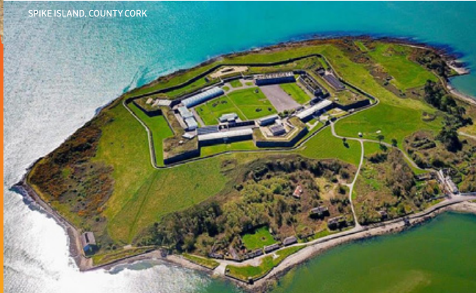
SPIKE ISLAND, COUNTY CORK