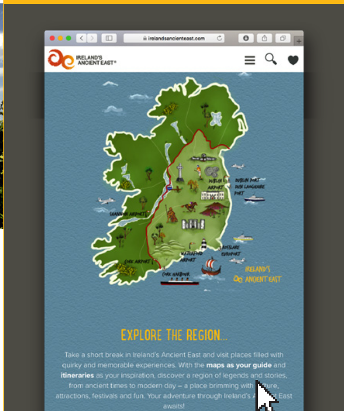
EXPLORE THE REGION

Pour la liste complète de tout ce qu'il y a à faire et à voir dans la région y compris la pêche à la ligne, les randonnées à vélo, à cheval, les terrains de golf, les randonnées, et bien plus encore — veuillez consulter www.irelandsancienteast.com